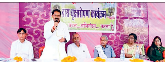
हरिभूमि न्यूज ►► माटापारा