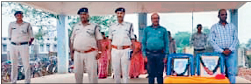
हरिभूमि न्यूज ►► बलौदाबाजार

पुलिस स्मृति दिवस पर सोमवार को जिले में पुलिस विभाग द्वारा शहीदों का सम्मान एवं श्रद्धांजलि कार्यक्रम का आयोजन किया गया। इस मौके पर पुलिस अधिकारी-कर्मचारियों ने अध्यनरत स्कूल कॉलेज में शिक्षकों, छात्र-छात्राओं को शहादत दिवस के बारे में जानकारी दी।